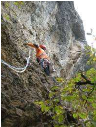
I tiro. All'inizio del traverso