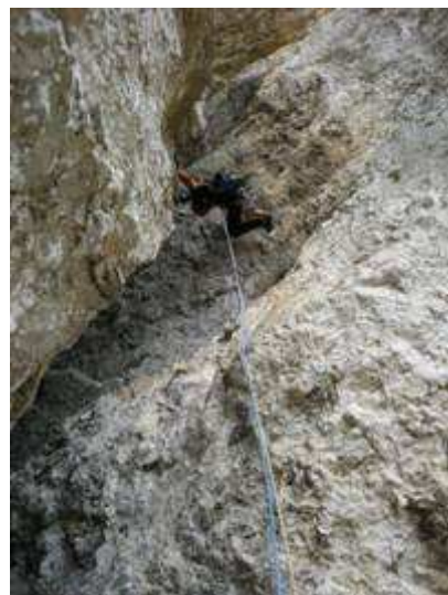
VII tiro: il profondo camino