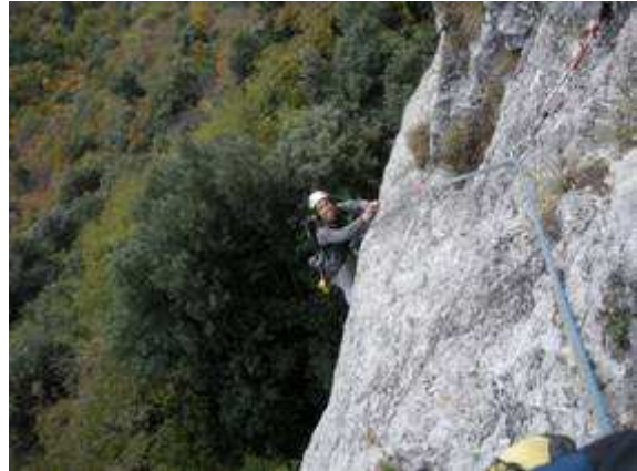
II tiro: l'uscita della placca grigia