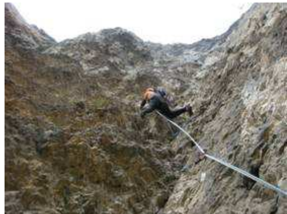
V tiro: Si traversa a sinistra