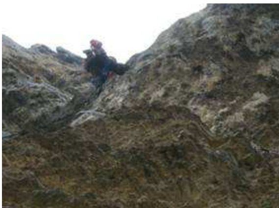
V tiro: Sul muro in artificiale