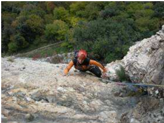
IV Tiro: Diedro rossiccio