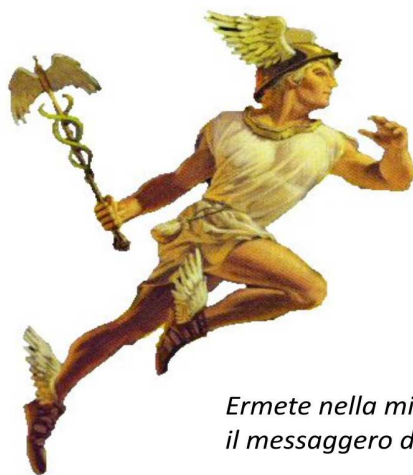
Ermete nella mitologia romana   il messaggero divino.

Le tracce verso la parete sud permettono una breve e comodo arrivo. Circa 50 m prima della cengia, dove iniziano le vie del Sole, si deve girare a destra (ometto) e andare fino all'attacco. Il nome della via   scritto alla base.