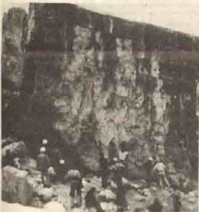
Uno degli enormi macigni dietro il rifugio: è l'ideale per le esercitazioni pratiche.

Il rifugio Silvio Agostini e da diversi anni sede della scuola di roccia Giorgio Graffer. Di proprietà della Sat, sorge al limite della vegetazione della val d'Ambiez, ai piedi dell'omonima cima; dispone di 60 posti letto e di locale invernale sempre aperto. La sua posizione, decentrata rispetto alle zone più tradizionalmente frequen-