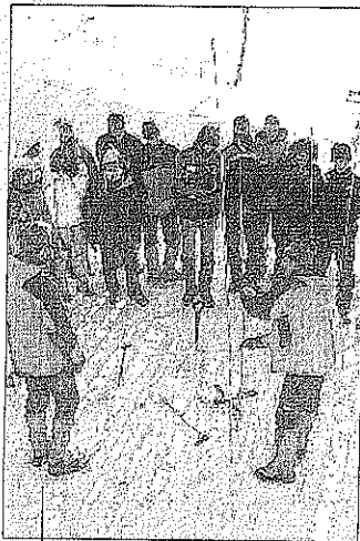
Una lezione sull'Arva tenuta in ambito Sat

invalicabili per avere un'alta percentuale di sopravvivenza. Sicuramente ognuno dei presenti si è convinto che è molto meglio, e comunque assolutamente necessario, applicare tutte le «misure preventive» - quelle illustrate il giorno prima - per evitare di essere costretti a «cercare» l'amico sepolto (o di essere cercati)... L'ultima prova, con l'oscurità che incombeva, è terminata a vin brulè, cioccolate e torta, anche un po' per scacciare il leggero senso di angoscia che la simulazione della «ricerca dell'amico sepolto» ha generato nella maggioranza dei partecipanti.