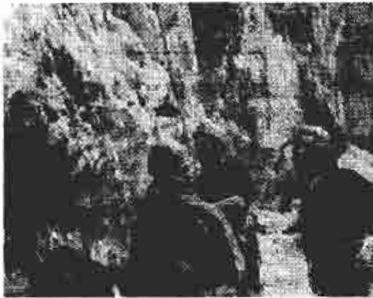
Allievi e istruttori della scuola di alpinismo «Giorgio Graffer» durante un corso di roccia

«I corsi sono quattro o cinque l'anno. Due di roccia, primaverile ed estivo, uno d'alta montagna, uno di sci alpinismo base e uno avanzato biennale. Forniamo agli allievi un bagaglio di nozioni di base necessarie per imparare a frequentare il mondo della roccia e dell'arrampicata classica, per muoversi in sicurezza sui sentieri, sulle pareti e sui ghiacciai, sapendo affrontare le prime difficoltà di una scalata in ambiente severo e difficile quale è quello dell'alta montagna. Inoltre è altrettanto importante conoscere e rispettare l'ambiente alpino».