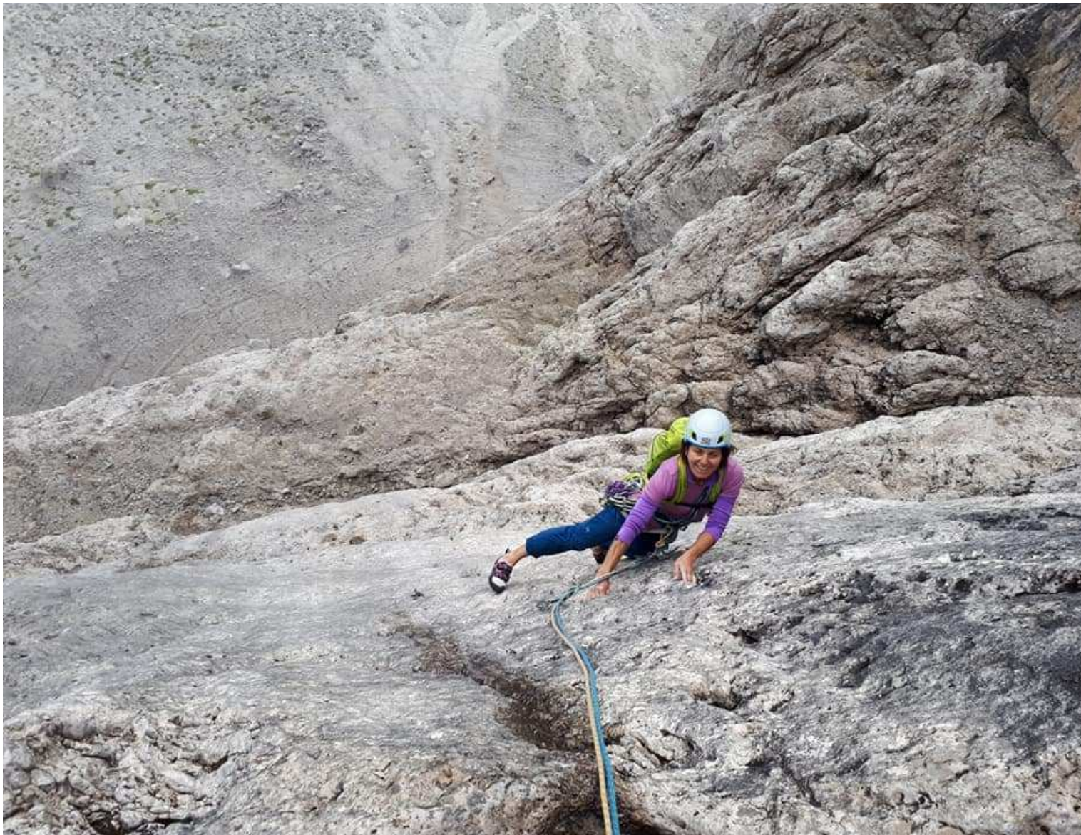
Caterina Mazzalai in arrampicata