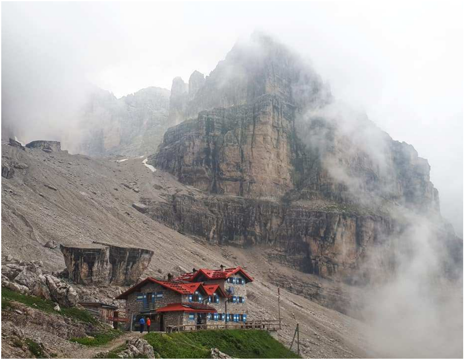
Il rifugio “Silvio Agostini” in Val D’Ambiez – Gruppo di Brenta