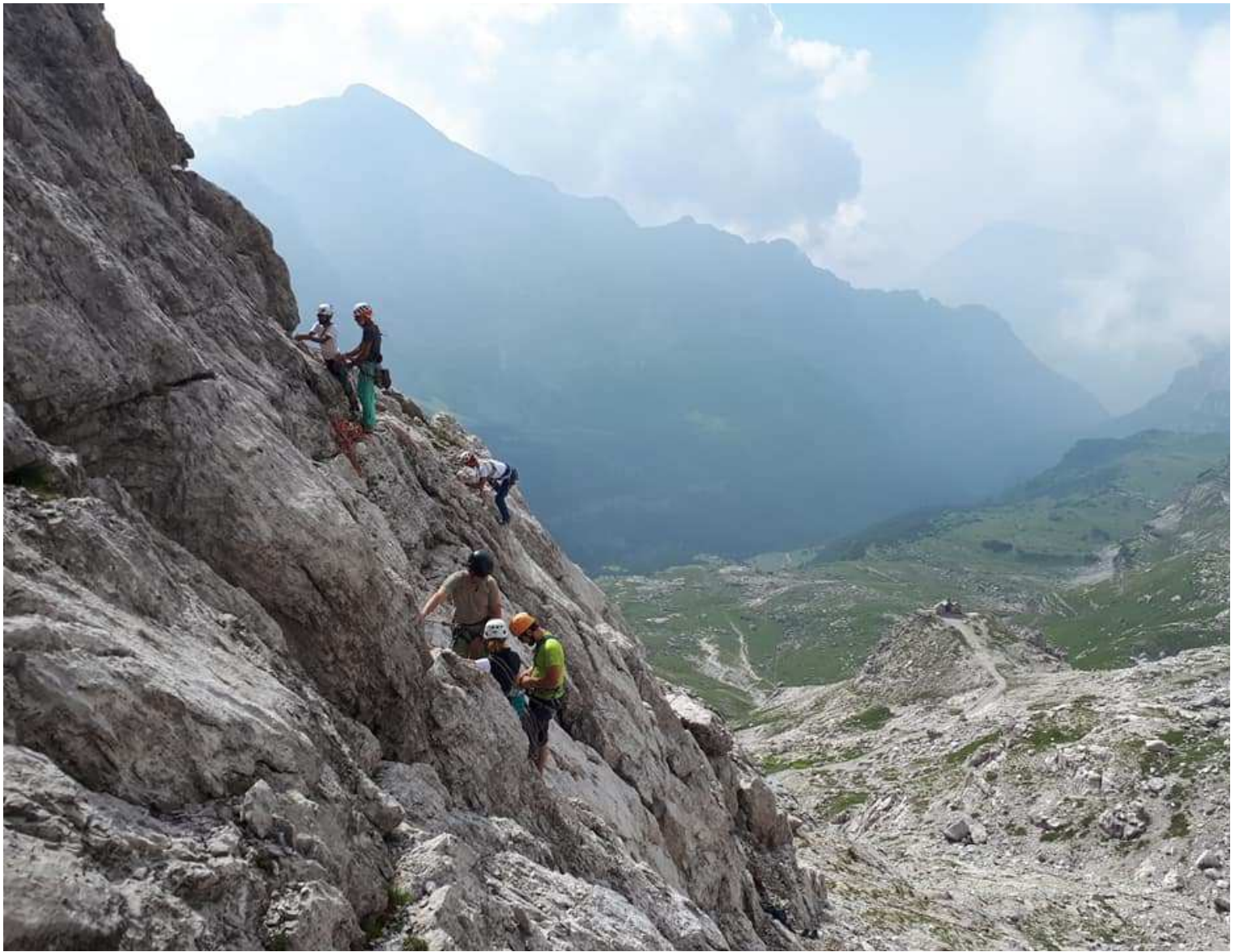
Soste e manovre di corda. La Scuola Graffer e la sicurezza

Caterina Mazzalai è presidente della sezione SAT di Ravina. Ha sempre avuto a cuore l'attività della sezione sia a livello di attività giovanile, escursionistica, alpinistica che didattica. Ha al suo attivo all'incirca 500 vie e fa parte del corpo istruttori della blasonata scuola di Alpinismo e Sci-Alpinismo" Giorgio Graffer Cai-Sat di Trento dove è istruttrice di alpinismo e sci alpinismo.