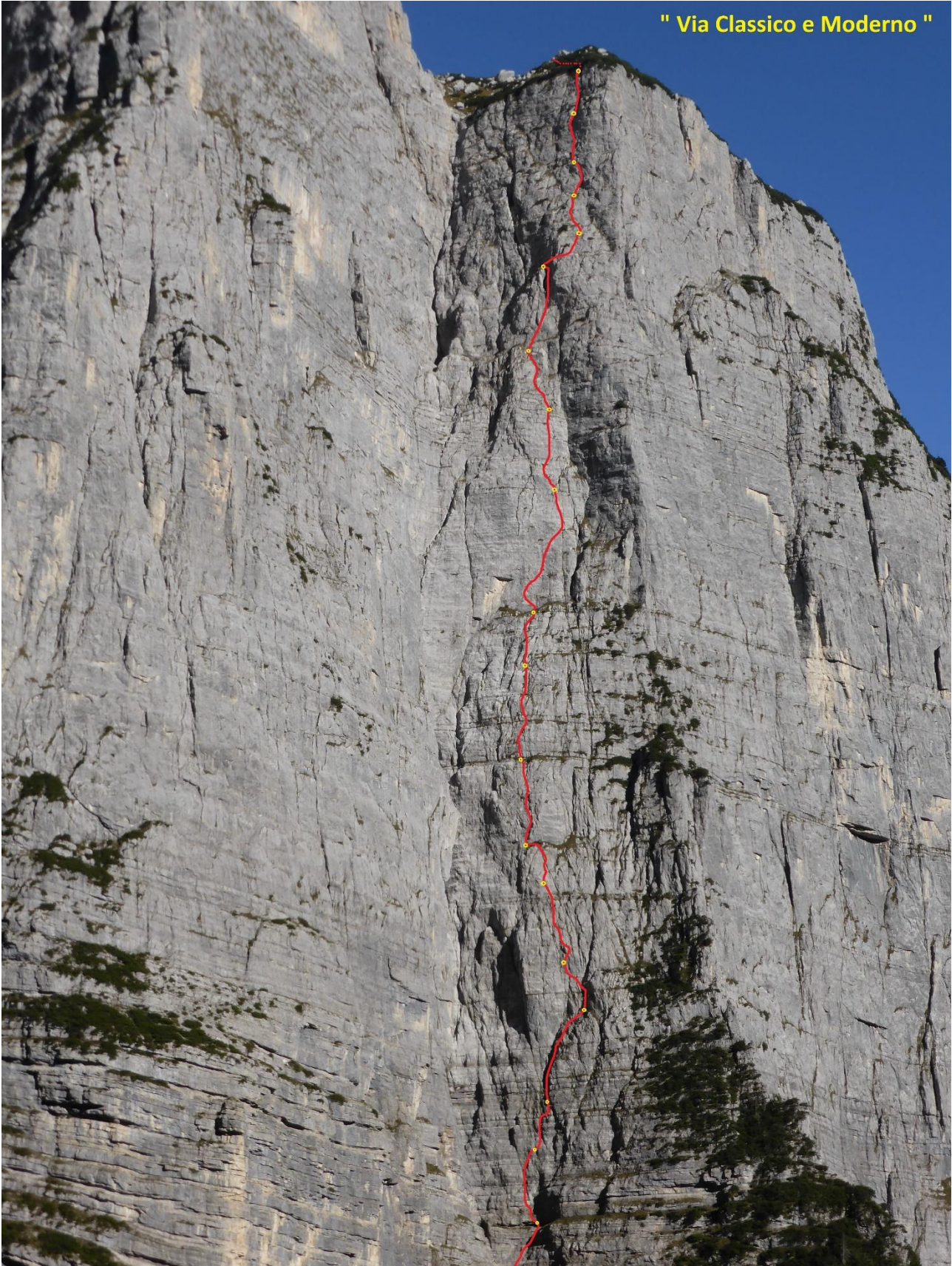
" Via Classico e Moderno "